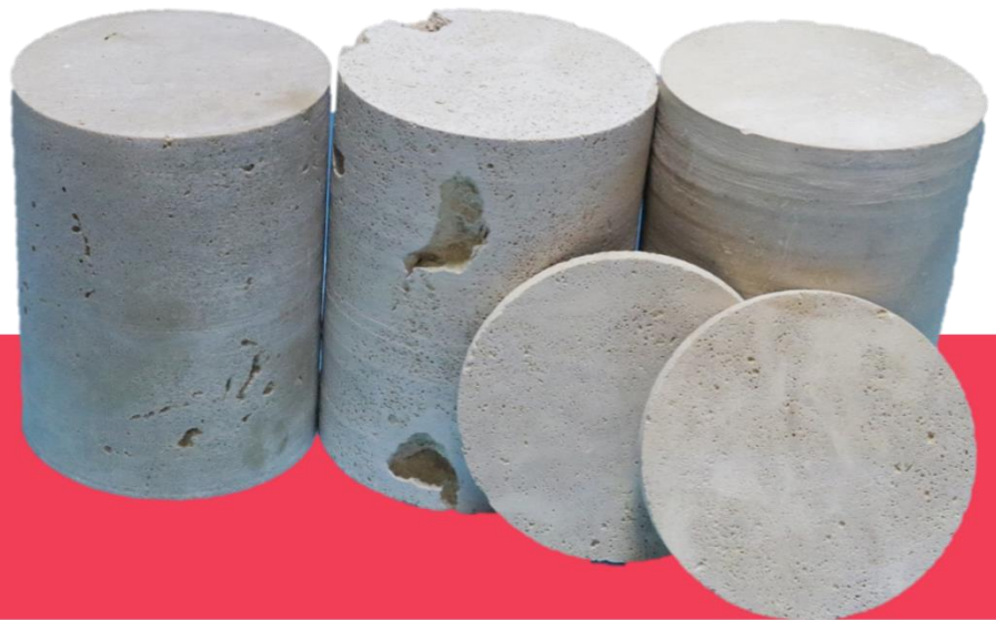
High-Permeable Limestone (Diameter: 8.5 cm)