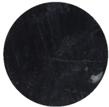
Chert (Chert Nodule)