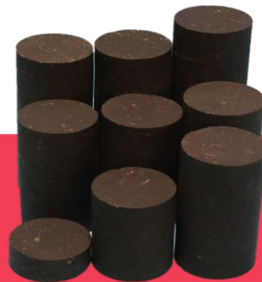
Naturally Oil Saturated Carbonate Rock