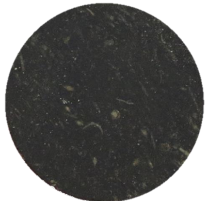
Naturally Oil Saturated Carbonate Rock