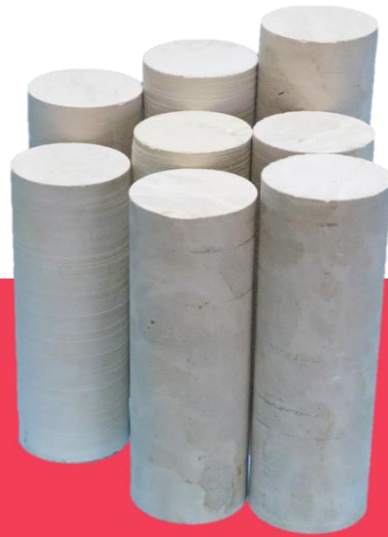
Low-Permeable Dolomitic Limestone