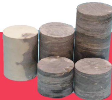
Chert (Chert Nodule)