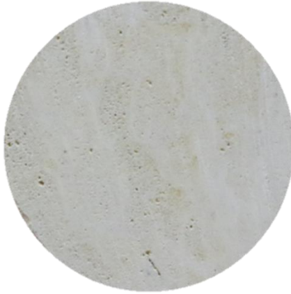
Low-Permeable Dolomitic Limestone