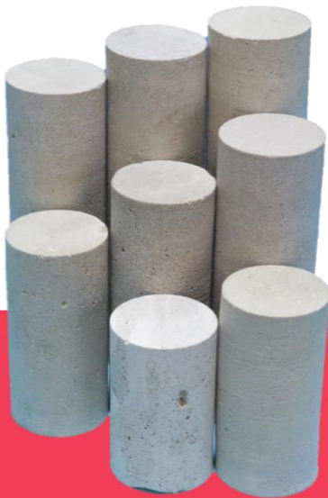
High-Permeable Limestone (Diameter: 3.8 cm)