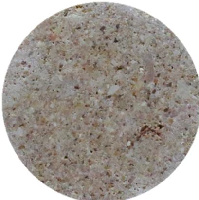
Dirty Sand Stone